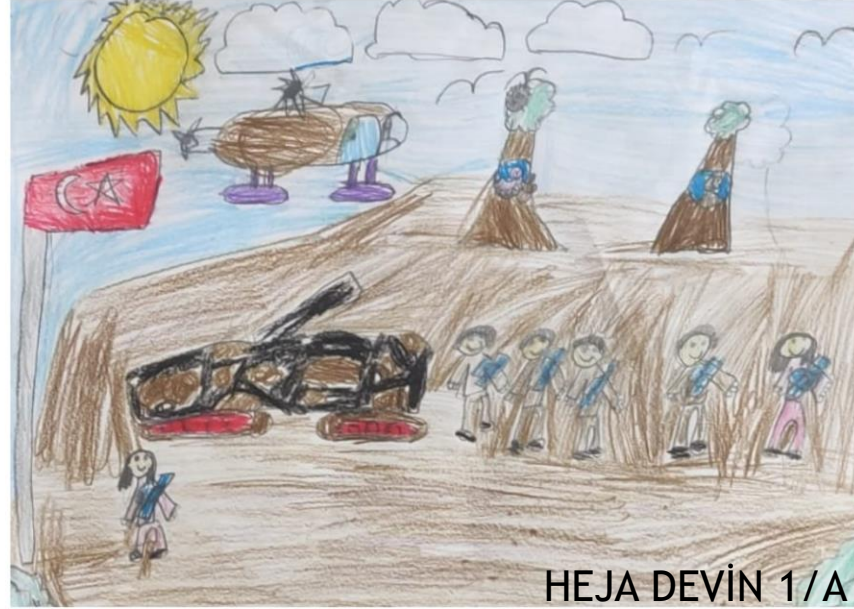
HEJA DEVİN 1/A

Vatan ve Milletini satan dinden, imandan ve namustan bahsedemez. ATATÜRK